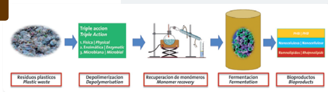
Figura 2. Esquema básico del proyecto BioICEP. | Figure 2. Basic schematic diagram of BioICEP project.

El esquema básico del proyecto BioICEP se muestra en la Figura 2. Este se basa en la depolimerización de mezclas de residuos plásticos mediante una acción combinada de diferentes métodos de degradación, como son métodos físicos, enzimáticos y microbianos. Esta acción combinada provocará la liberación de monómeros y oligómeros que serán empleados para la producción de nuevos bioproductos y bioplásticos de alto valor añadido mediante procesos biológicos como la fermentación.